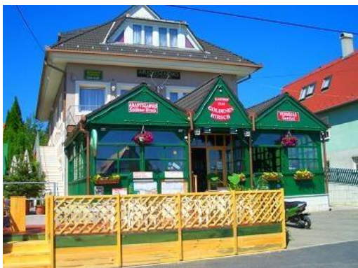
• Az étterem