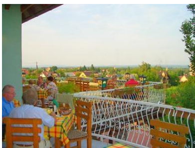
• A szállás